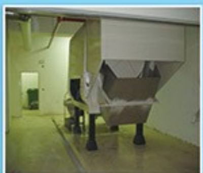
旋轉式佔用空間大，需考慮垃圾車接駁