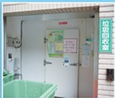
冷藏設備佔用空間大，耗電量大