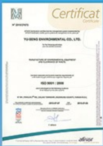
AFAQ ISO 9001認證

直立型密閉式垃圾壓縮機為郁勝環保股份有限公司所研究開發最新環保需求的專利產品，「專利字號:M262478、M293914、M326005、M358816」，本設備完全符合環保署最新環保法規規定（中華民國九十六年五月二十八日發文字號：環署廢字第0960039124號、一般廢棄物回收清除處理辦法），具有密閉、自動感應噴霧除臭、自動壓縮、多段感應自動保護...等功能，為最新垃圾貯存區標準配備產品，本設備可增加垃圾貯存容量，無污水排放問題，密閉式無臭味設計，自動感應噴霧消毒除臭，體積小不佔空間，設置簡易，採油壓傳動原理不產生噪音，本產品為最新環保標準設施，適用於社區住宅大樓、飯店、學校、醫院、養護中心、幼稚園、百貨公司、賣場...等大型公司機關團體。