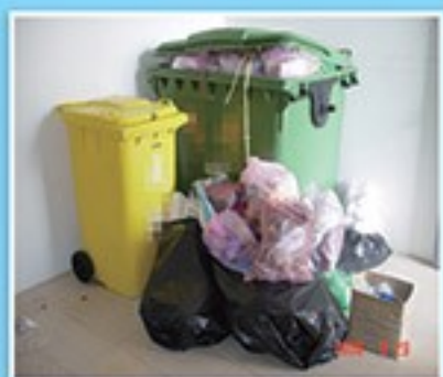
一般子車無壓縮，貯存環境髒亂