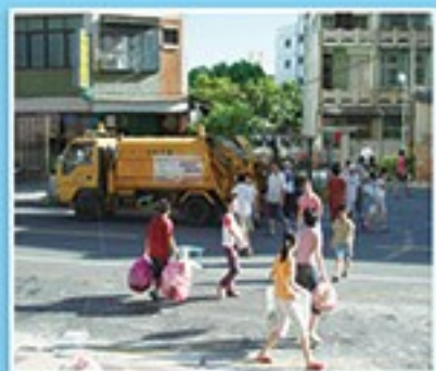
追趕垃圾車，橫越馬路，險象環生